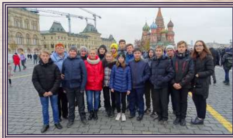
Ученики 8 класса в Москве на Красной площади.